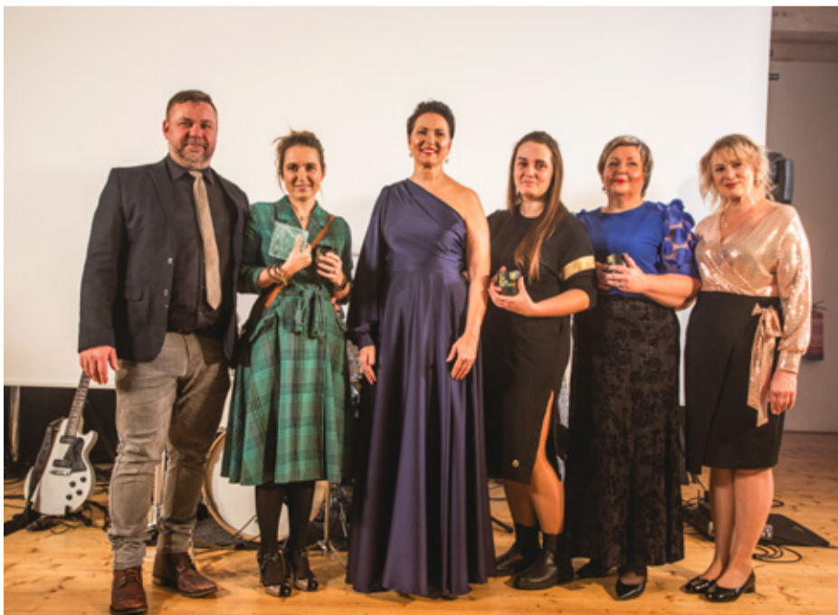
TÕELINE KALATEGU 2025 – MTÜ KALLASTE SELTS.