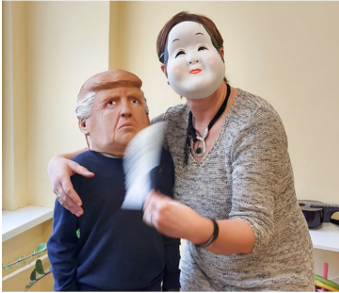
Pildil õpetaja Pille ja õpilane.