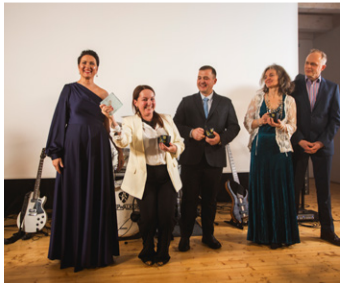
TEGIJA KALA 2025 – SLAKER OÜ.