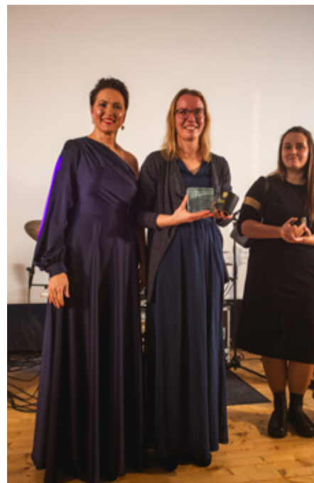
UUS KALA 2025 – KRONGI TALU OÜ.