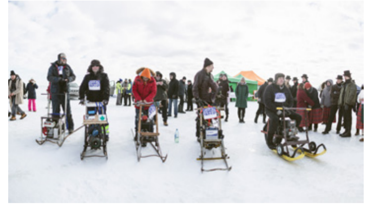
Motoriseeritud tõukekelgud minemas Kolkja Kelgu võistlusrajale.

Peipsiääre valla kultuuri- ja vabaajakeskuse kultuuritööspsialist