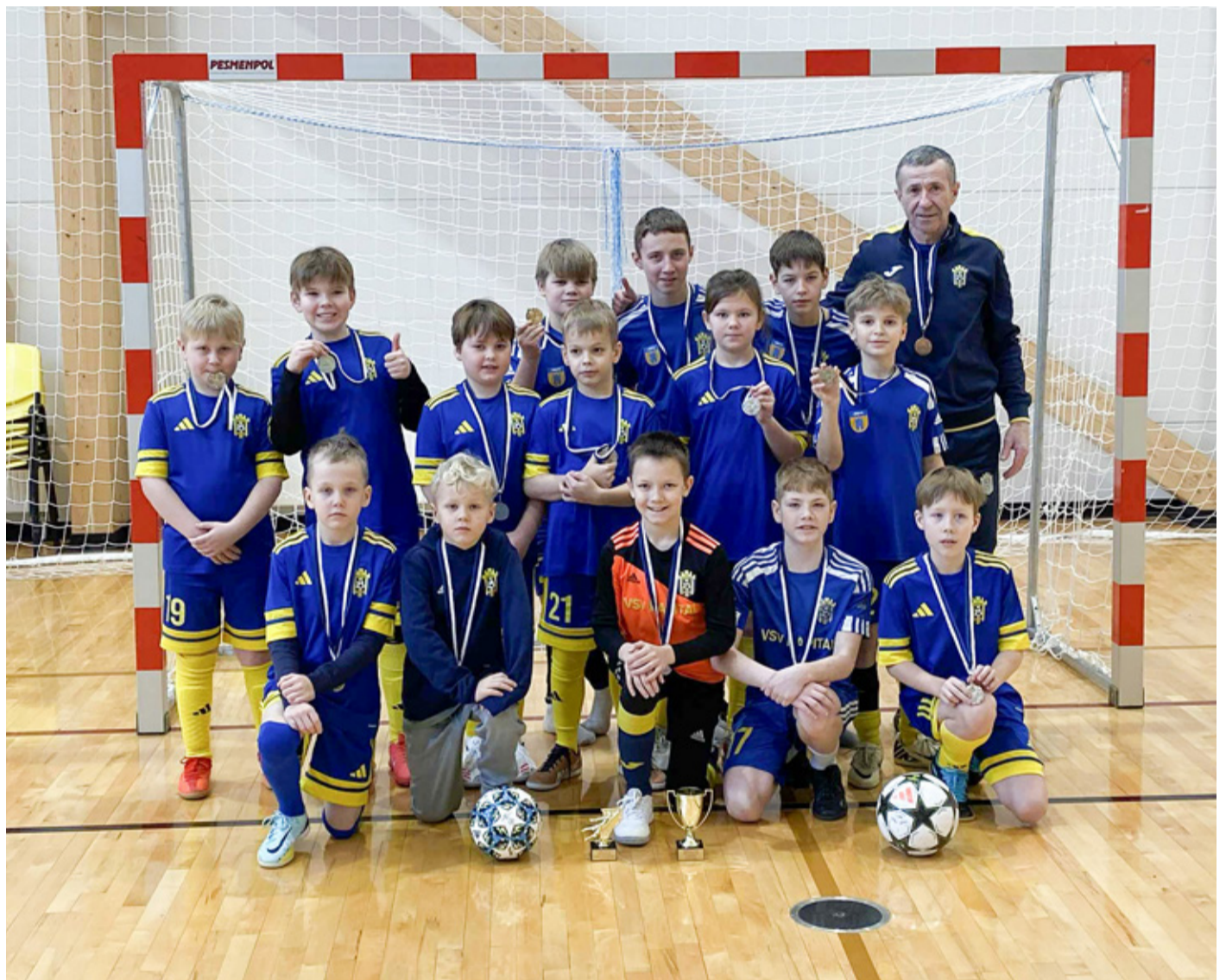
2014–2015 vanuseklassi poiste võistkond.