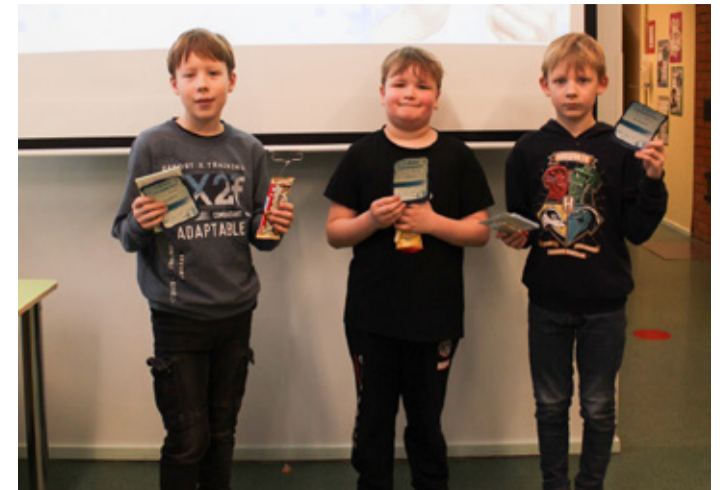
Fotokonkurss „Talve värvid“ võitjad.

Juhan Liivi nim Alatskivi kooli direktor