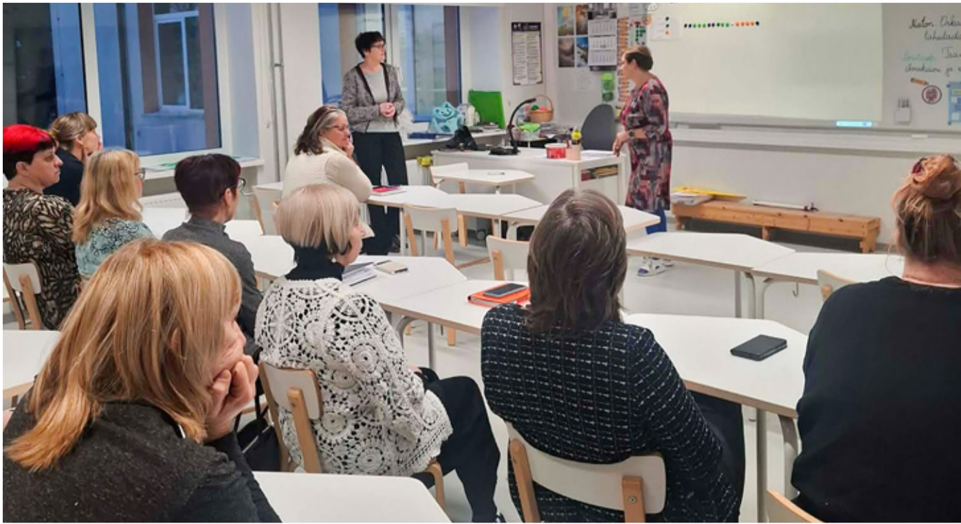
Õpetajate koolitus.