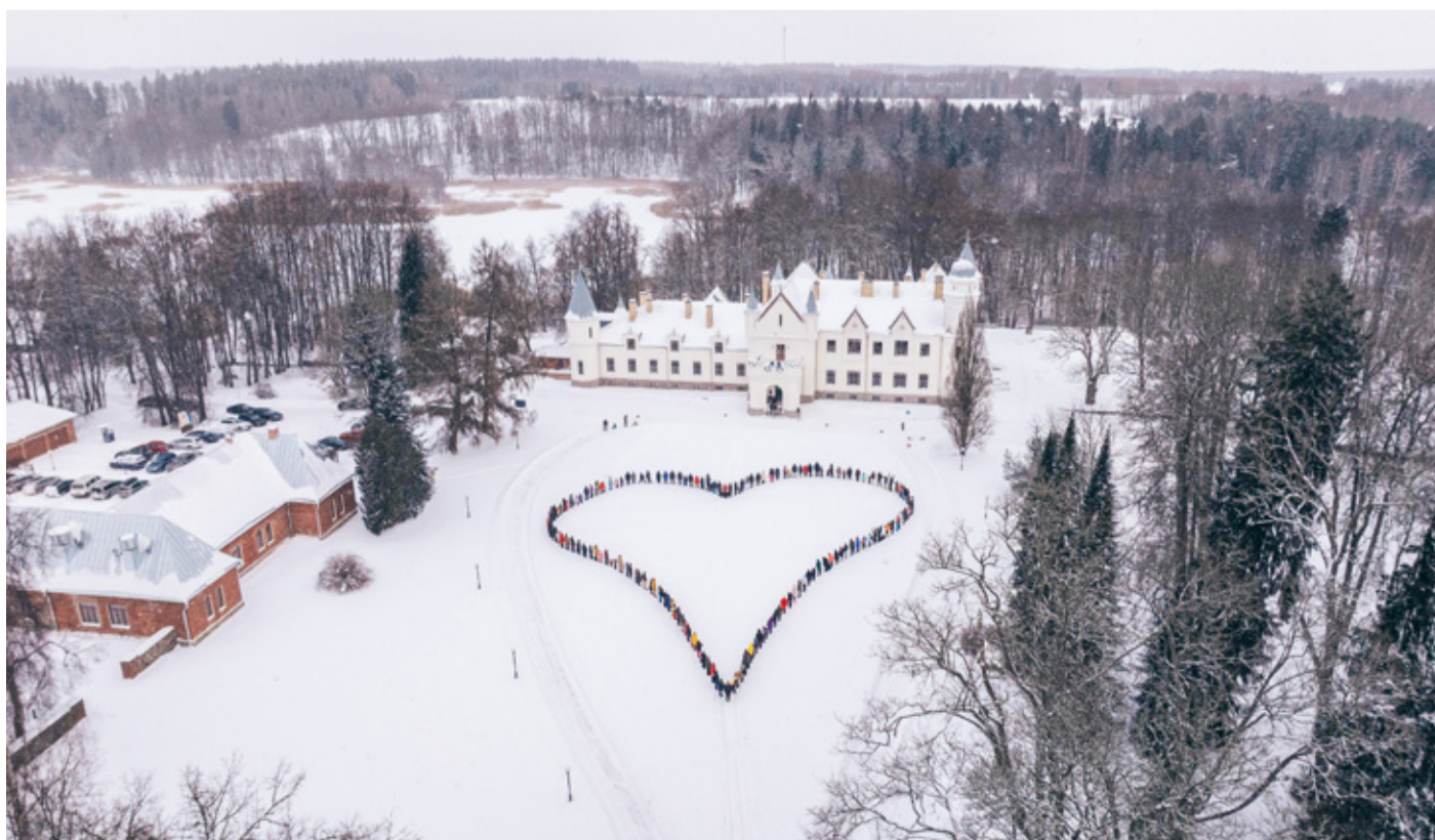
8. veebruaril Alatskivi lossi ees moodustatud südames osales kokku 167 inimest. Märkige kalendrisse – 7. veebruaril 2027 kohtume taas Alatskivi lossi esiväljakul!