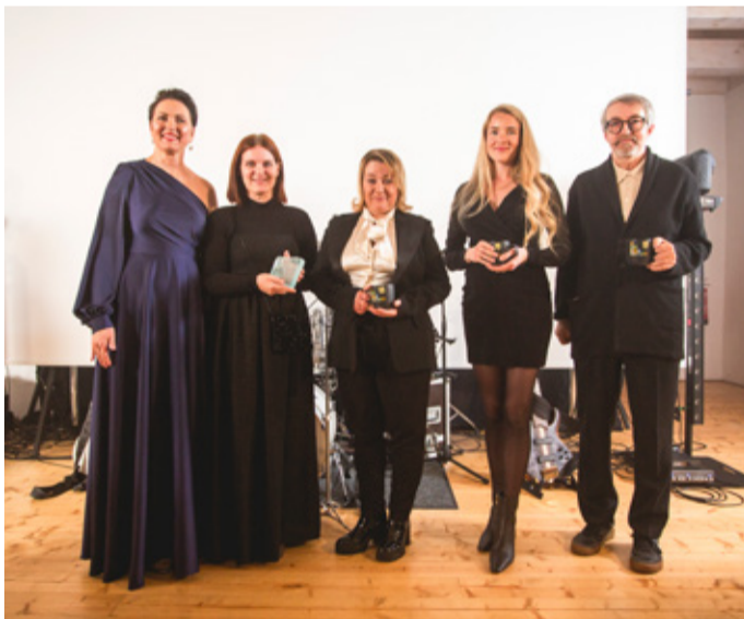
KUMU LOOV KALA 2025 – Voronja galerii.