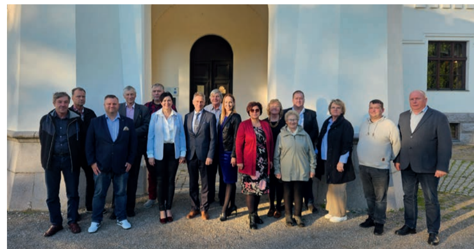
24. septembril Alatskivi lossi ees tehtud pildil pole kahjuks esindatud kõiki endisi vallavolikogu liikmeid.

Kadri Külaots avalike suhete spetsialist