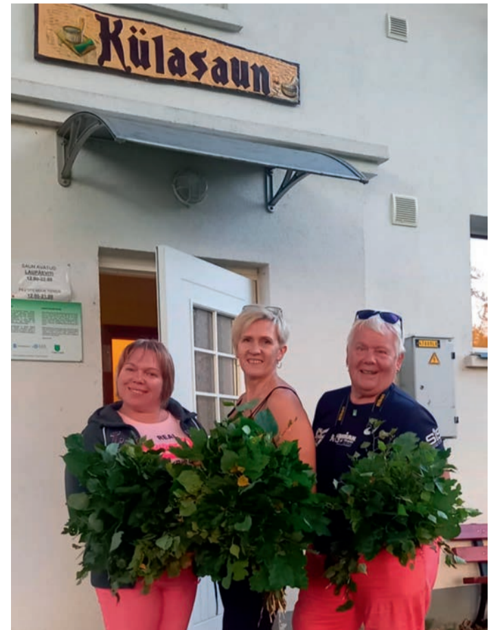
Äsjane saunaskäik Koosale.

Koosa saun on nii kodune ja õdus, on tunne, nagu oleksime privaatsaunas, vahel pole peale meie teisi saunalisi. Märk sellest, et kasvav elukallidus maal mõjutab ka saunas käimisi. Olime juba mitu kõva vihtlemist kahe vihaga ette võtnud, kui tuli veel saunalisi, nii oma külast kui Tartu kandist.