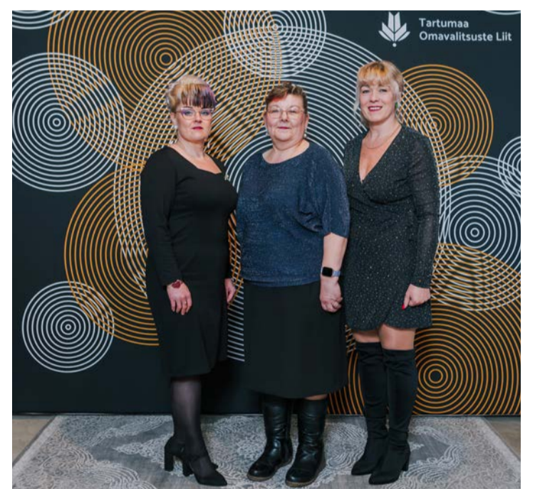
Tänusündmusel oli esindatud ka Anna Haava nim Pala Kool.

Head kokad ja köögiperso- nal, te olete osa laste õppi- mist, kuigi klassiruumi teie ise ei lähe. Aitäh teile selle kan- natikkuse, loovuse ja hooli- vuse ees, ilma teieta poleks meie koolipäev päriselt tervik- lik. Soovin teile jõudu, rõõmu ja jaksu, et te tunneksite iga päev, et teie töö on väga suur väärtus! Suur-suur aitäh teile!