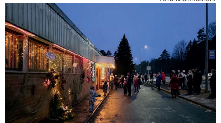
Tuledesäras aknaid olid vaatama tulnud paljud huvilised.