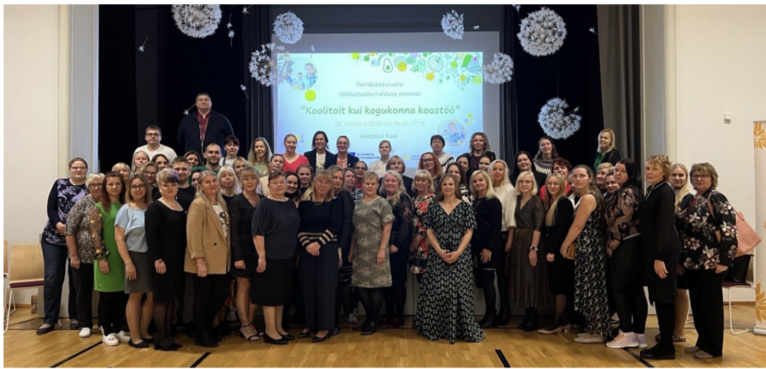
Seminar tõi Alatskivile kokku haridus- ja toitlustuse eest vastutajad.

Tartumaa Omavalitsuste Liit ja Peipsi Koostöö Keskus korraldasid 28. novembril seminari „Koolitoit kui kogukonna koostöö“, kus keskenduti küsimusele, kuidas tagada õpilastele tervist toetav ja maitsev toit uue haridus- ja toitlustamist reguleeriva määruse „Nõuded laste toitlustamisele haridus- ja sotsiaalteenuse osutamisel ning püsi- ja projektlaagris“ valguses.