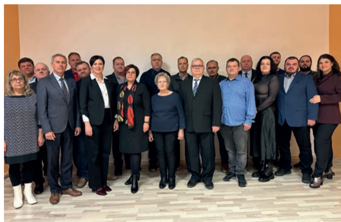
Peipsiääre Vallavolikogu III koosseis.