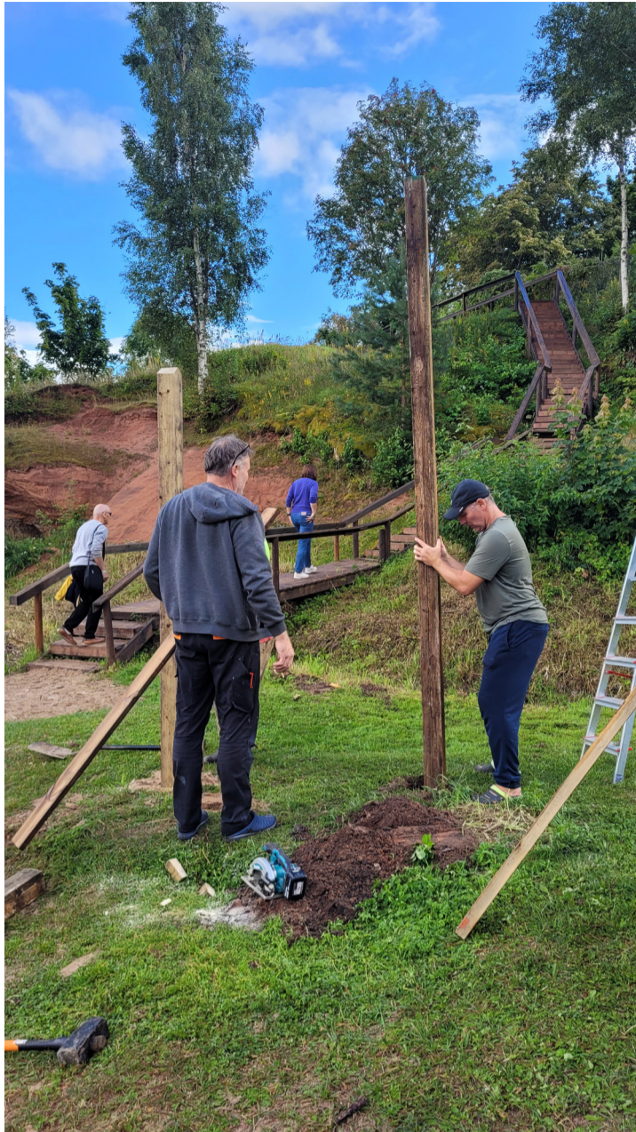
Infotahvli taastamine ning taustal parandatud Kallaste paljandi trepp.

Siiras usk Kallaste linna potentsiaali tõi kokku inimesed, kes polnud küll Kallastel sündinud, kuid on tänaseks linna arengusse panustanud rohkem kui nii mõnigi elupõline linlane. Nii sündis Kallaste selts, mis ehitab, korraldab ja inspireerib – kõik selleks, et Peipsiäärne linnake liiguks edasi ning muutuks aasta-aastalt elavamaks ja küllastajatele sümpaatsemaks.