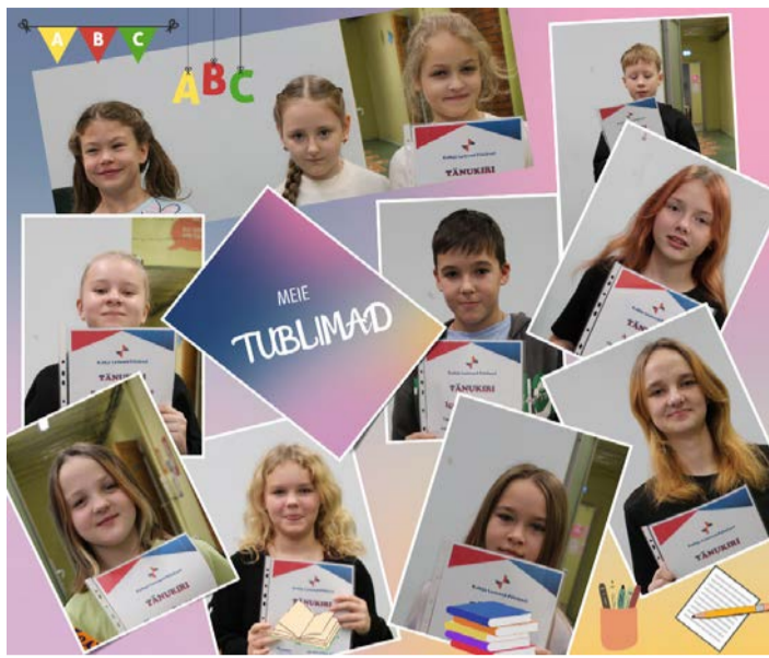
I trimestri tublimad õpilased.

Detsembrisse mahub meil palju jõulusoojust ja erilisust. Sel aastal pühendame jõulu-