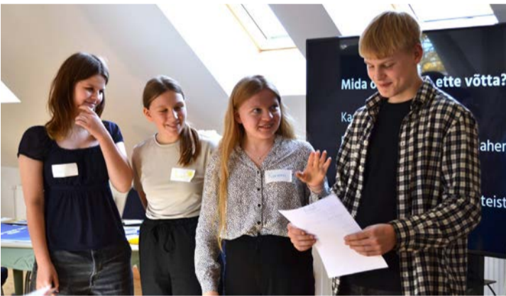
Üks tiimidest noorte häkatonil.

Lõppev aasta kujunes Peipsiääre vallale eriliseks – meie vald sai tunnustatud kui Läänemere Kultuuripärl 2025. See prestiižne tiitel käib koos kohustusega elavdada kohaliku kogukonna kultuuri, hoida ja edendada meie eripärast pärandit ning kaasata aktiivselt valla elanikke ühiselt tegutsema ja ideid ellu viima.