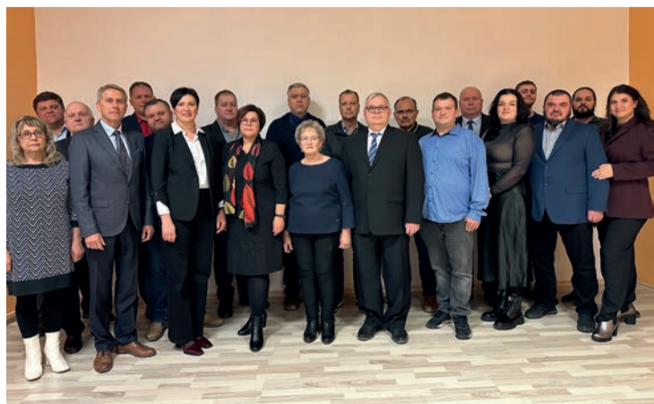
На фото - III состав Волостного собрания Пейпсиääре.