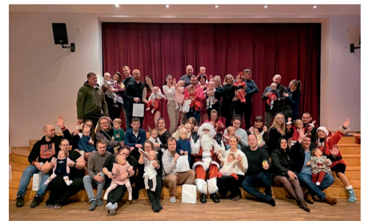
Peipsiääre beebide ja koduste laste jõulupidu.