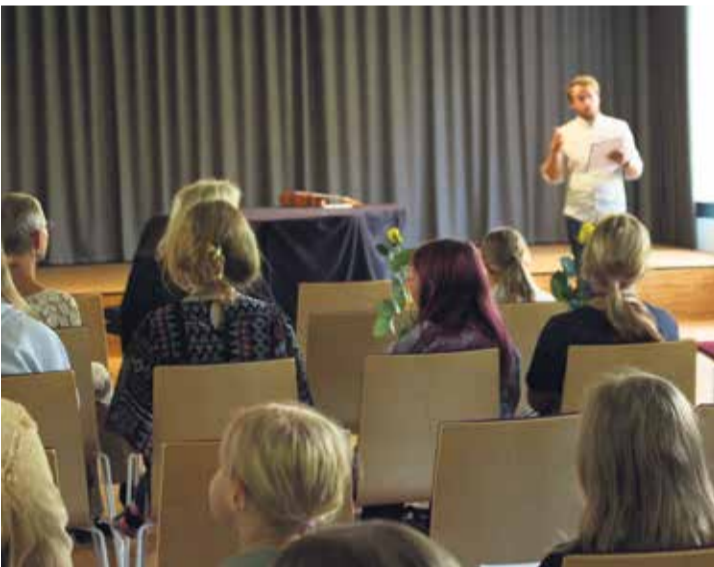
Alatskivi Kunstide Kooli õppeaasta avaaktus.

Alatskivi Kunstide Kooli alustasid 2025/2026. õppeaastal põhiõppega nii täiesti uusi nägusid kui ka juba tuttavaid noori, kes soovivad ennast proo-