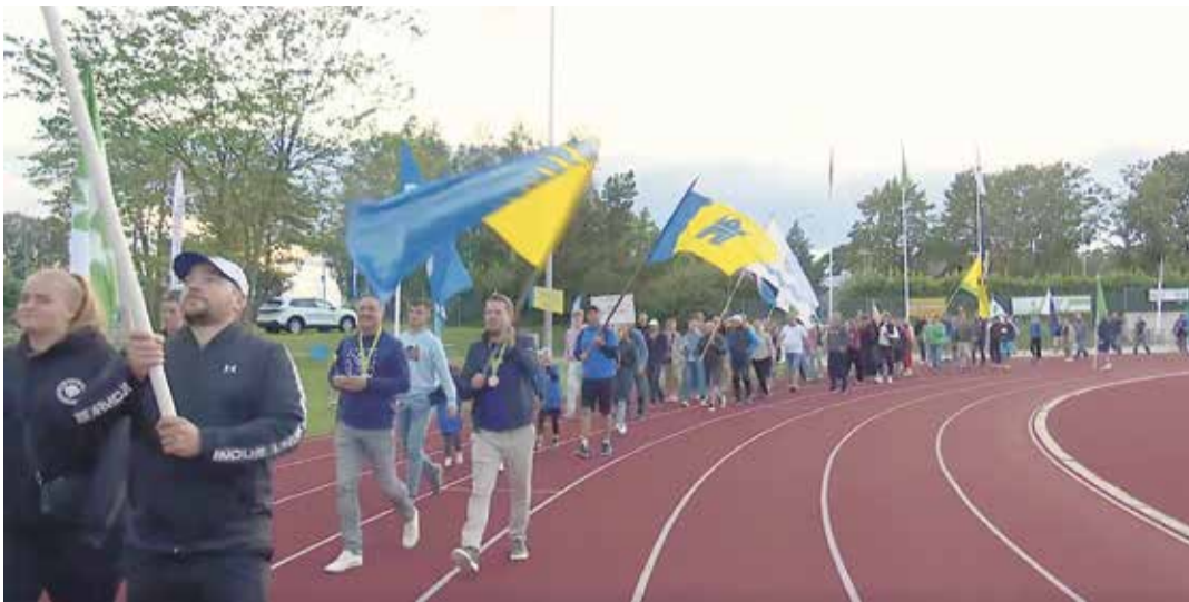
Väljavõte 50. suvemängude rongkäigust.

Peipsiääre vald oma elanike arvuga kuulub keskmisesse arvestusse ning seal saavutati tänavu 50. Eesti omavalitsuste suve-