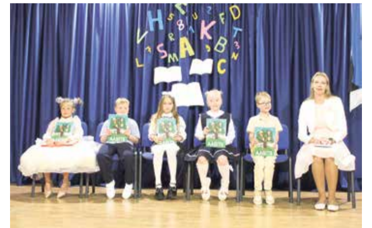
1. klass õppeaasta avaaktusel.