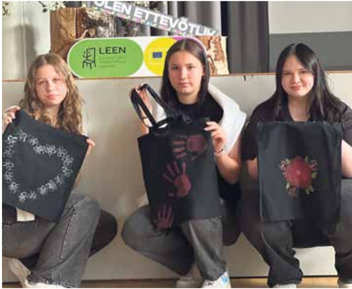
5. mail Juhan Liivi nim Alatskivi koolis Peipsiääre valla 7.–8. klasside karjäärpäeval.

„Oleme saanud käia koolitusel ja arendada erinevaid oskuseid väljaspool kooli, õppinud üksteisega arvestamist ja