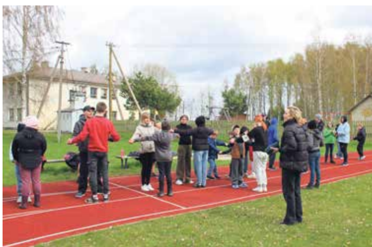
Tuustepi tantsimine tantsupäeval.

9. aprillil käis meie kooli Liikuma Kutsuva Kooli programmi meeskond Tallinnas