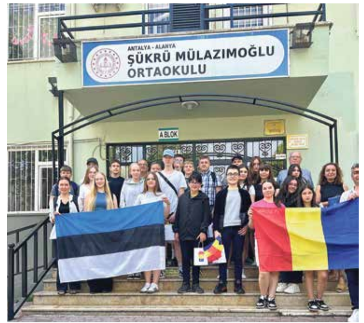
Erasmus+ õpirändeprojektis „Digikunstikool“.

Juhan Liivi nim Alatskivi Kooli direktor, Erasmus+ projektide koordinaator