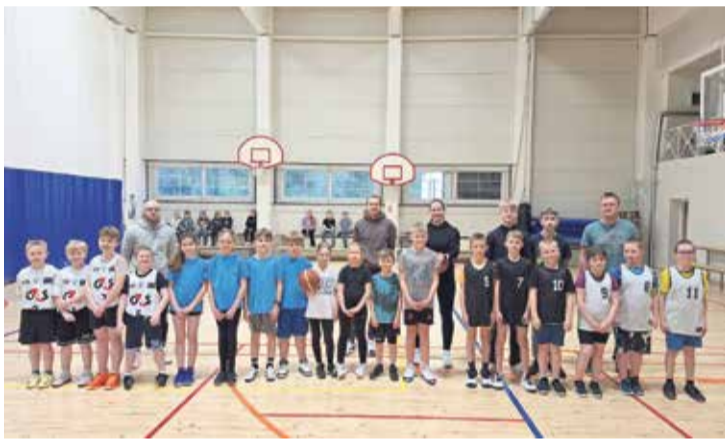
Pala Cup 2025 osalejad Tormast, Alatskivilt ja Palalt.

Aprillikuu algas koolis teistmoodi koolikoti päevaga ehk vajaminevad kooliasjad tuli kaasa võtta millegi muu kui