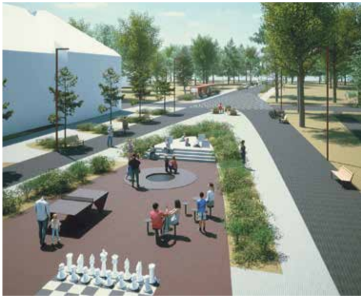
ВИЗУАЛ: OÜ АВМА