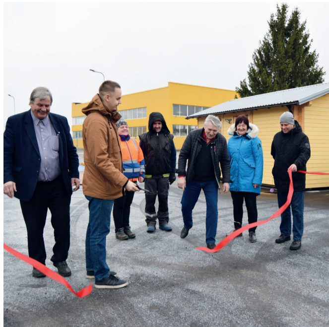
12. veebruaril avati Alatskivi jäätmejaam.