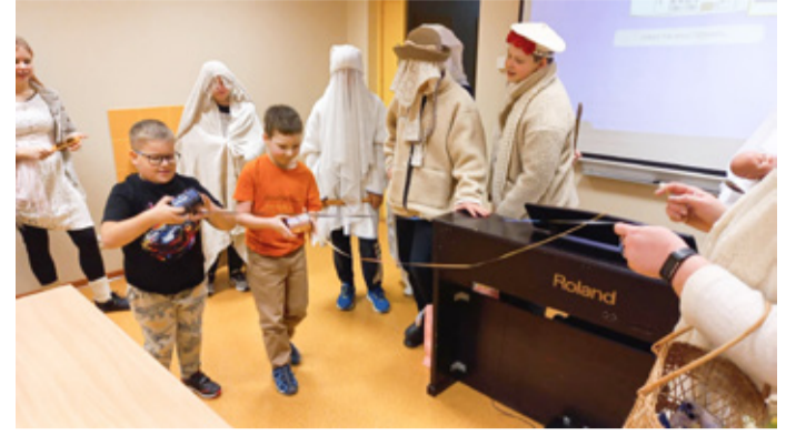
Kadrisandid 1. klassi näppude nobedust testimas.

29. novembril külastasid 7.–9. klassi õpilased Tartumaa Omavalitsuste Liidu korraldatud karjääripäeva Elvas „Kuidas kujundada oma unistuste karjäär?“. Üritusel said õpilased