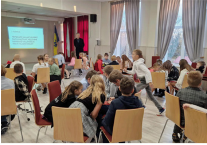
I trimestri lõpus murti pead mälumängus.