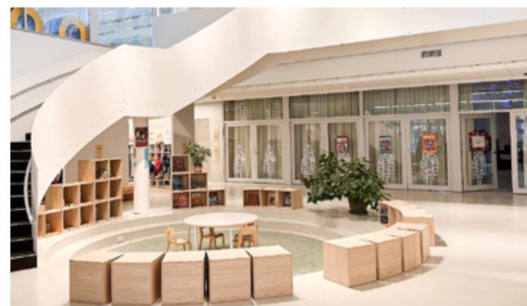
Illustreeriv pilt Kuressaare Pargi lasteaia fuajeest.

Kohtumistel selgus, et Vara ja Kolkja töötajad ning vanemad lasteaedade ümberkorraldamist ei poolda. Võttes arvesse eri piirkondade kogukondade seisukohti, kujunes plaan teha ühendamine etapiliselt: esmalt ühendada 3 lasteaeda, teises etapis liita veel 2 lasteaeda. Ka töögrupi lõppseisukoht oli minna edasi 3 lasteaia ühendjuhtimise alla viimisega.