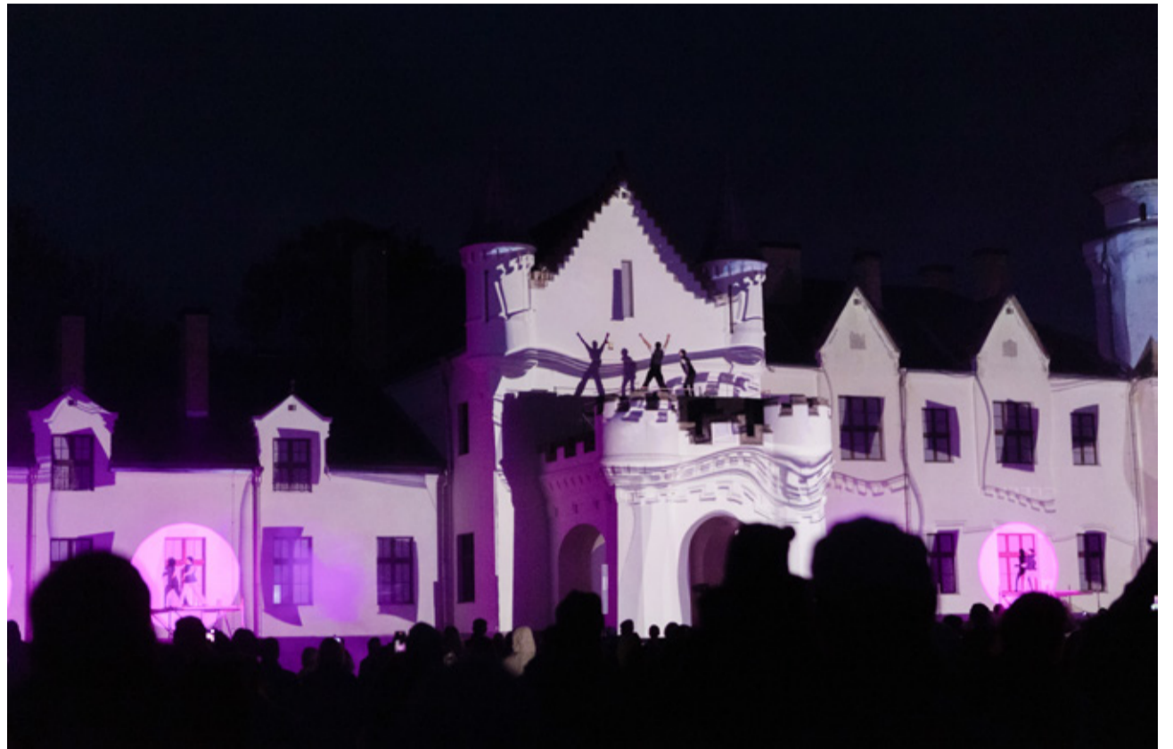
Euroopa kultuuripealinn Tartu 2024 põhiprogrammi kuulus ka valgusfestival „Alatskivi valgus“.

Tartut ja Lõuna-Eestit külastas sel aastal 90 kõrgetasemelist delegatsiooni 1400 külalisega 20 erinevat riigist. Kultuuripealinna tegemisi