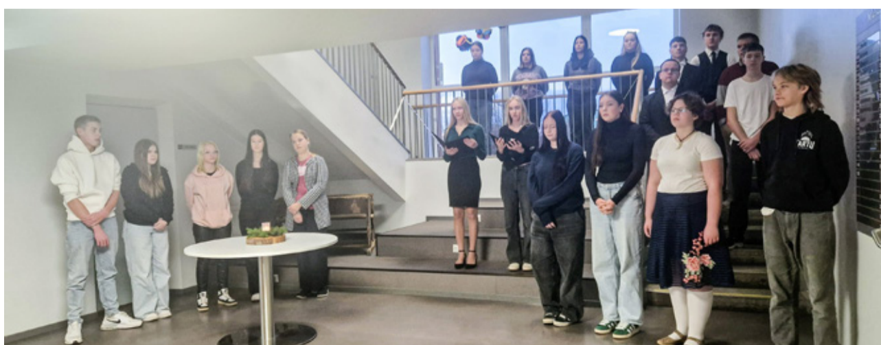
Juhan Liivi mälestushommik.

Detsember on ka praktilise õppimise aeg. Meie koolis tekkiv minifirma Art Life osales 2. detsembril juba kolmandal minifirmade koolitusel. Koolituse teema oli seekord turundus. Noored said ideid ja löid koolituse käigus oma firmale Instagrami konto. Varem on minifirma osalenud Tartumaa minifirmadele mõeldud koolitustel