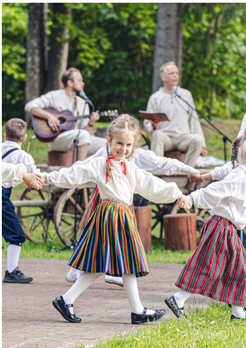
Kogukonda siduv Kodavere tantsupidu toimub 7. juunil 2025.

Läänemere Kultuuripärliks saamise teekond aitab Peipsiääre vallal läbi töö-