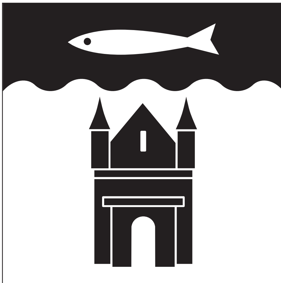
Lipu laiuse ja pikkuse suhe on 1:1, normaalsuurus 105x105 cm.